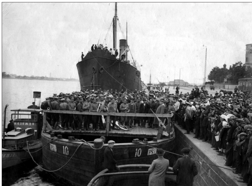
13.-14. att. Liellaivas ar brīvprātīgajiem latviešu strēlniekiem dodas ceļā no Daugavmalas uz Mīlgrāvi. Rīga, 1915. g. 14. augusts