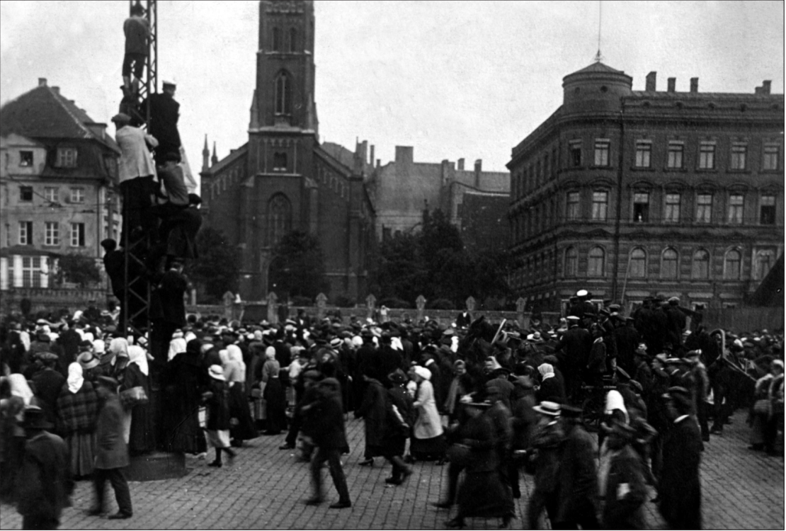
12. att. Brīvprātīgo latviešu strēlnieku pavadītāji Daugavmalā pie Anglikāņu baznīcas. Rīga, 1915. g. 14. augusts