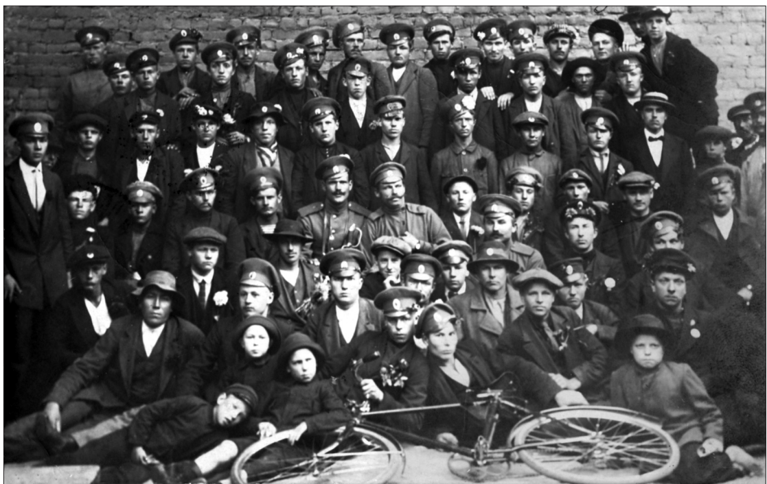
4.-8. att. Brīvprātīgie latviešu strēlnieki un viņu pavadītāji teātra "Olimpija" pagalmā pirms došanās uz Daugavmalu. Rīga, 1915. g. 14. augusts