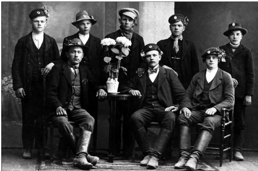
9.-11. att. Latviešu strēlnieku bataljona brīvprātīgie. Rīga, 1915. g. 14. augusts