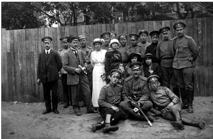
2. att. Latviešu strēlnieku bataljonu brīvprātīgie ar pavadiņtājiem. Rīga, 1915. g. 14. augusts