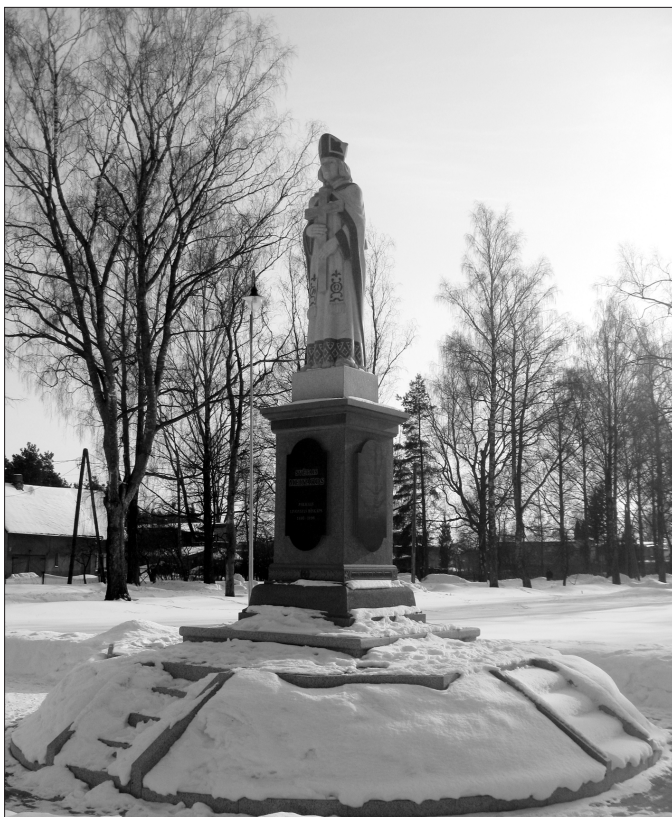
2. att. Bīskapa Meinarda pieminēklis Ikšķīlē. Tēlnieks Viktors Šušķēvičs. Atklāts 2010. gada 25. septembrī.

Pabraucot garām minētajiem ciemiem, Meinards nonāca Ikšķīles ciemā . Šīs apdzīvotās vietas pirmsākumi meklējami 11. gadsimta beigās vai 11./12. gadsimta mijā, tomēr visintensīvāk tas apdzīvots 12.–13. gadsimtā. 1198. gadā nākamajā dienā pēc tam, kad Salā tika kristīti 50 cilvēki, Ikšķīlē nokristīja ap simtu. 58 12.–13. gadsimta apbūvei pāri sedzas 15. gadsimta celtniecības objekti ar tiem raksturīgajām hipokausta tipa siltumkrāsniem. 59