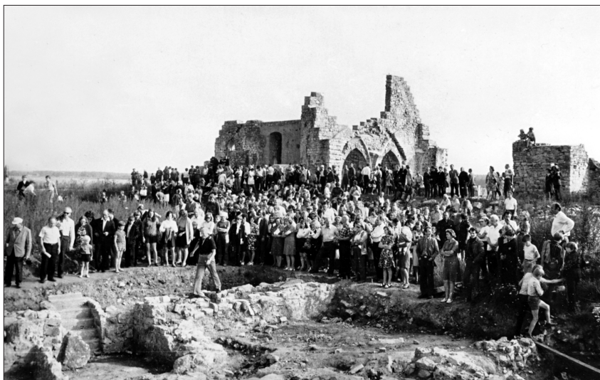
Ikšķiles ciema arheoloģisko izrakumu noslēguma skate 1975. gadā pulcējusi daudzus interesentus. Vidū uz atsegtajiem mūriem izrakumu vadītājs J. Graudonis