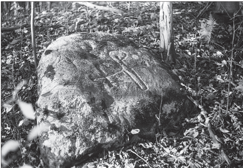
2. att. Meiru robežakmens ar Rīgas arhibīskapa heraldisko simbolu – sakrustotu bīskapa zizli un krustu – apmēram 1,5 km attālumā no Turaidas pils.

Kokneses fogti apliecināja dokumentus ar amata zīmogiem 1417. gadā, 64 Kokneses fogts – 1428., 1509., 1541. gadā u.c. 65 Diemžēl fiziski dokumenti nav saglabājušies, lai arī 19. gadsimtā tika fiksēts dokuments ar Turaidas fogta zīmoga nospiedumu 66 (1. att.). Ir zināms 15. gadsimta Kokneses fogta zīmoga 67 un 15.–16. gadsimta Turaidas fogta bronzas zīmoga spiedņa apraksts. 68 Uz zīmogiem bijuši uzraksti latīņu valodā – “Turaidas fogta zīmogs” ( sigillum – advocati – toreiden ) un “Kokneses fogta zīmogs” ( sigillum