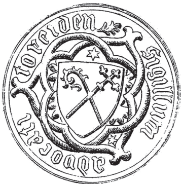
1. att. 15.–16. gadsimta Turaidas fogta zīmoga nospiedums

Kokneses fogti apliecināja dokumentus ar amata zīmogiem 1417. gadā, 64 Kokneses fogts – 1428., 1509., 1541. gadā u.c. 65 Diemžēl fiziski dokumenti nav saglabājušies, lai arī 19. gadsimtā tika fiksēts dokuments ar Turaidas fogta zīmoga nospiedumu 66 (1. att.). Ir zināms 15. gadsimta Kokneses fogta zīmoga 67 un 15.–16. gadsimta Turaidas fogta bronzas zīmoga spiedņa apraksts. 68 Uz zīmogiem bijuši uzraksti latīņu valodā – “Turaidas fogta zīmogs” ( sigillum – advocati – toreiden ) un “Kokneses fogta zīmogs” ( sigillum