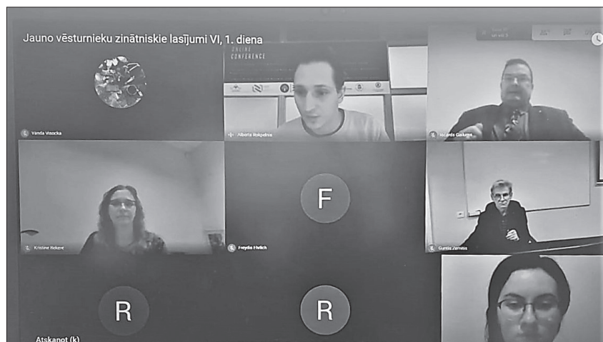
3. att. Starptautiskā konference “Jauno vēsturnieku zinātniskie lasījumi VI” tiešsaistē 2020. gada 27. novembrī. Ekrānuzņēmums

Pārskata periodā institūtā īstenoti trīs Eiropas Reģionālās attīstības fonda (ERAF) projekti un pēcdoktorantūras projektu konkursa